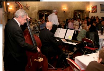
Soirée de gala