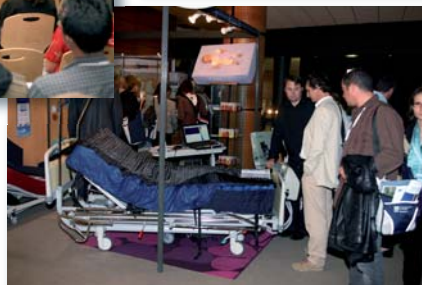
Visite des stands